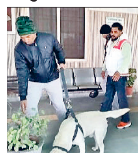
अंबाला। उपायुक्त कार्यालय की जांच करते पुलिस का डॉग स्कॉर्वियड।

उसमें उपायुक्त कार्यालय में आरडीएक्स बेरुड ईआईडी होने की सूचना थी। इस पर सुरक्षा की दृष्टि से तुरंत संज्ञान लेते हुए पुलिस को सूचित किया। उन्होंने बताया कि पुलिस ने भी तुरंत कार्रवाई अमल में