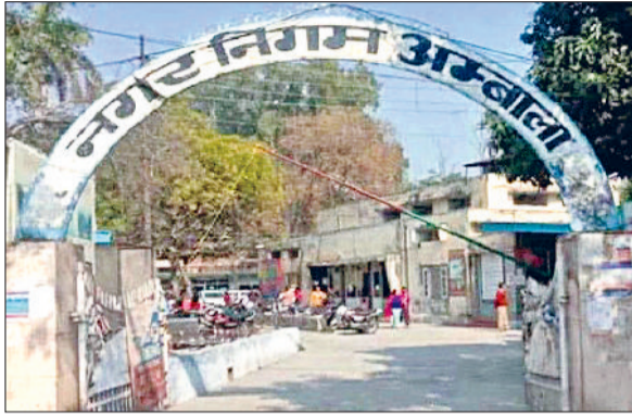
अंबाला। नगर निगम ऑफिस की फाइल फोटो।

नोटिफिकेशन में आरक्षित व अनारक्षित वार्डों की विस्तार से दी जानकारी, नई नोटिफिकेशन में अनुसूचित जाति को दो वार्डों का नुकसान