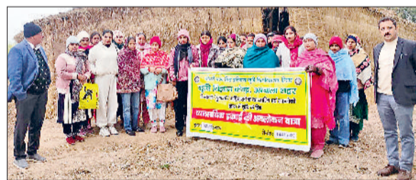
अंबाला। मशरूम की खेती को लेकर जागरूक करते अधिकारी।