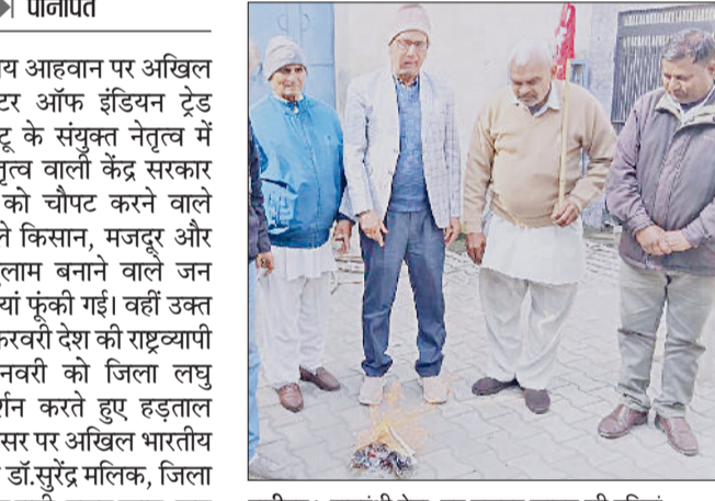
पानीपत। वामपंथी नेता, नए मजदूर कानून की प्रतियां जलाते हुए।