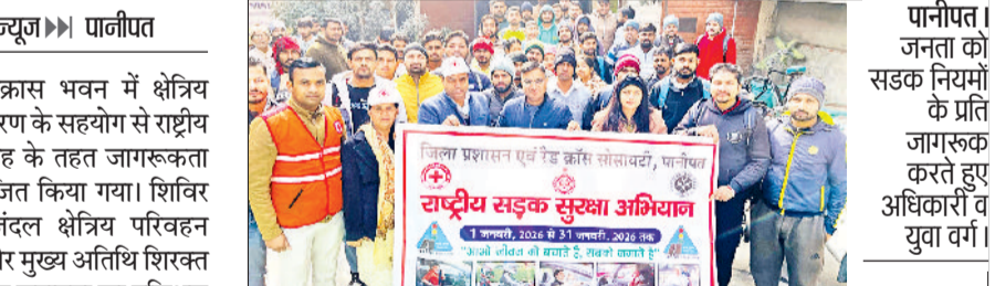
पानीपत। जनता को सड़क नियमों के प्रति जागरूक करते हुए अधिकारी व युवा वर्ग।