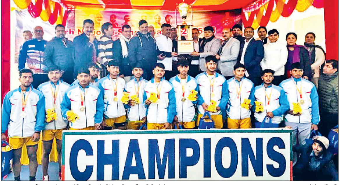
समालखा। 69वीं स्कूल नेशनल चैंपियनशिप की विजेता खिलाड़ी अतिथियों के साथ।